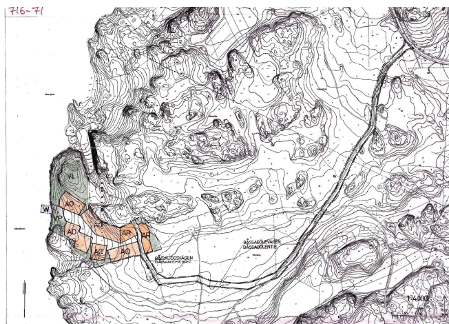
Utdrag av detaljplan 716-71 Ote kaavasta 716-71