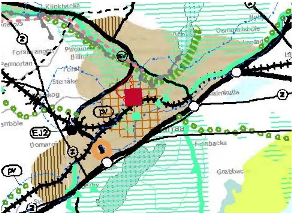
Kuva 2. Ote Uudenmaan maakuntakaavan ja 2. vaihemaakuntakaavan yhdistelmäkartasta. Kaava-alueen rajausta punaisella viivalla.

Tiivistettävän alueen merkintä osoitetaan taajama-alueelle, joka tukeutuu kestävään liikennejärjestelmään. Sitä on kehitettävä taajaman muita alueita tehokkaammin ja joukkoliikenteeseen, kävelyyn ja pyöräilyyn tukeutuvana.