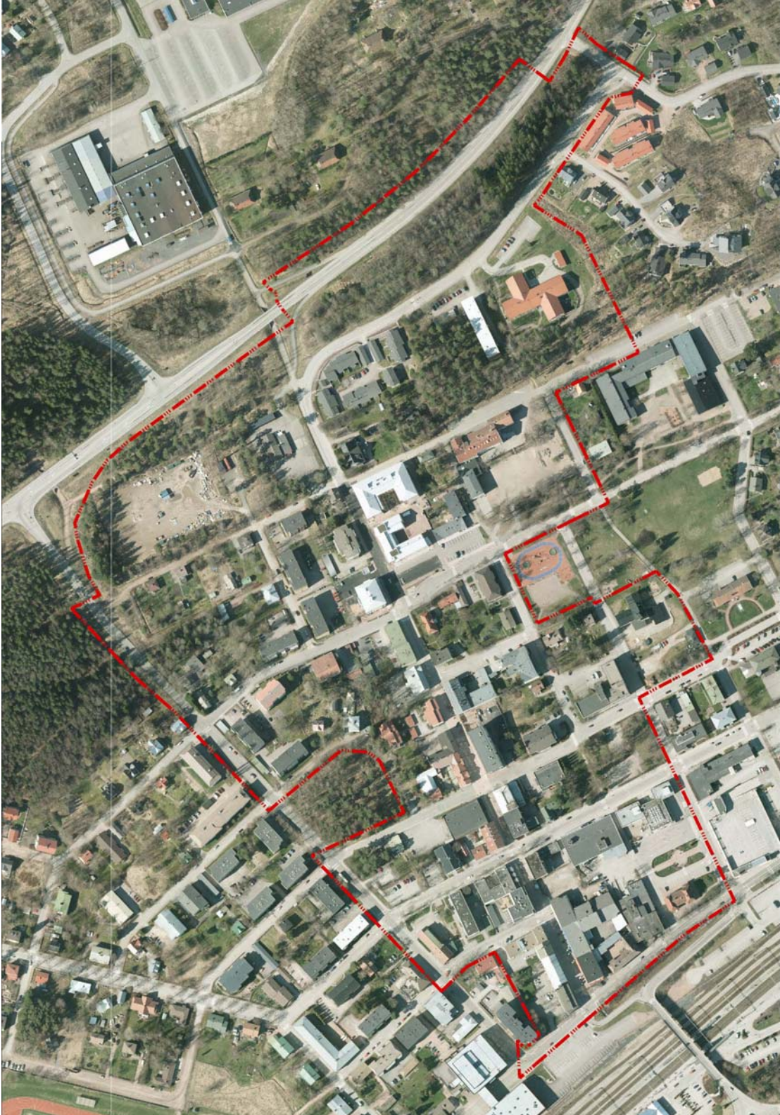
Kuva 1. Alue ilmakuvalla. Kaava-alueen rajaus punaisella viivalla.